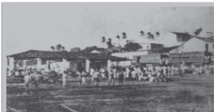
Foto (04) Vista do grande movimento de pessoas no espaço do galpão do Passo da Pátria no início do século XX. Não existe nenhuma referência ao autor da fotografia, apenas sua identificação como cartão postal de 1904.

Em 19 1870, passou a funcionar na localidade, aos sábados, uma feira popular, o que levou o Passo da Pátria a se tornar centro comercial, sendo um dos postos de abastecimento de mercadorias que procediam de Macaíba, São Gonçalo, Redinha e de outras povoações e que lá eram desembarcadas. Com a popularização do seu nome, aos poucos foi merecendo reformas. Durante o ano de 1877, a localidade recebeu a construção de um galpão para receber as pessoas que transpusessem o Potengi.